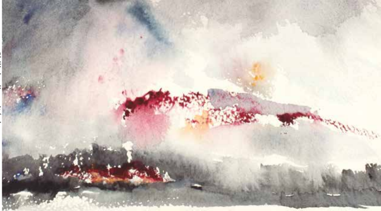
Aquarelles chiliennes en France