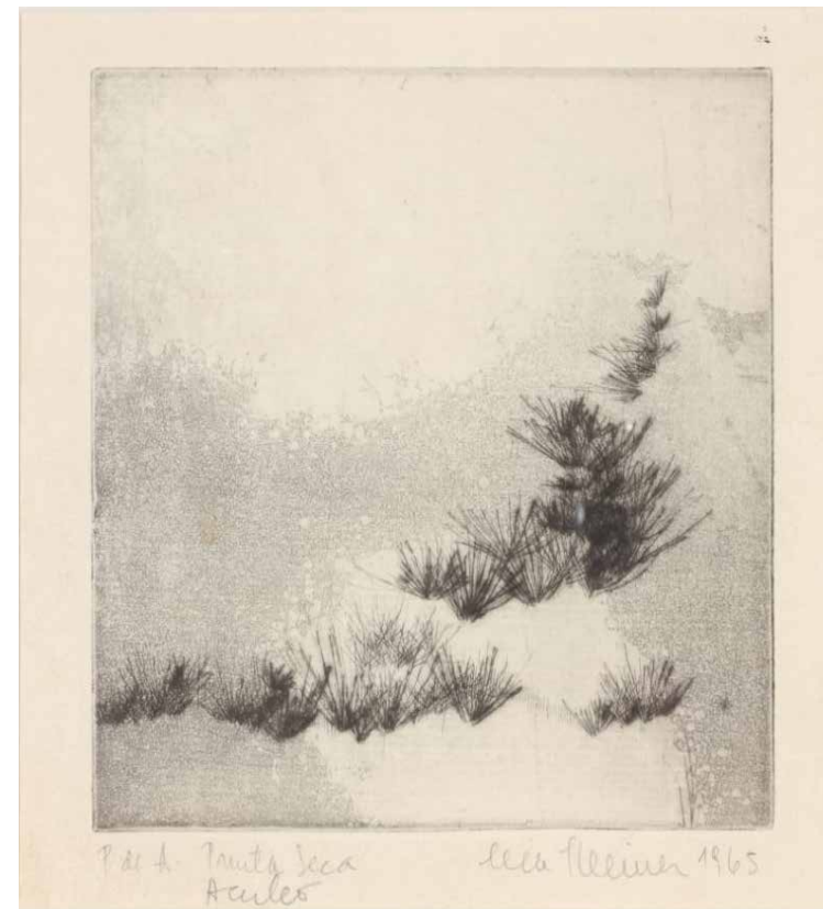
Aculeo, 1965. Grabado en metal.

Nace en Zagreb en 1929, en el Reino de Yugoslavia, actual República de Croacia. Vive en Chile desde 1939. Estudió en la Escuela de Artes Aplicadas de la Universidad de Chile y entre 1952 y 1997 se dedicó a la docencia artística. Estudió fotografía con Bob Borowitz y formó parte del Taller 99 por diez años. Su desarrollo en la acuarela se da de manera espontánea y orgánica. Hoy es reconocida como una de las exponentes más destacadas en esta disciplina.