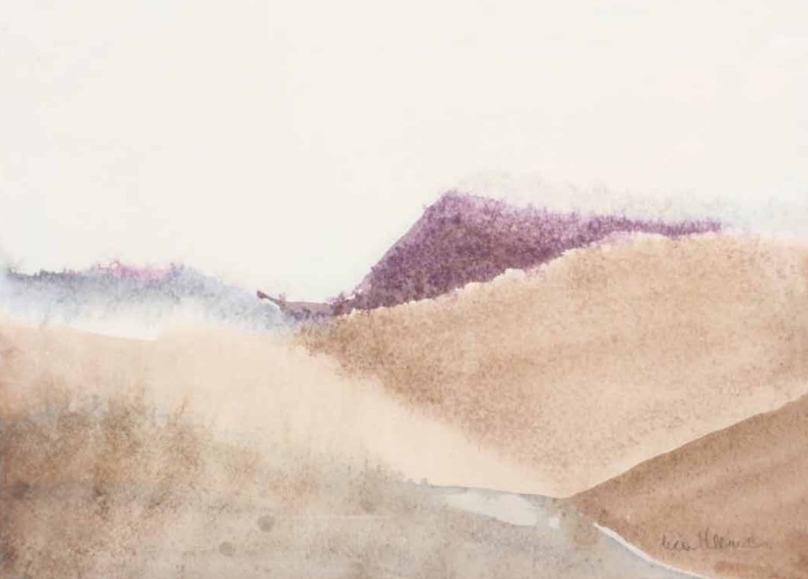
Valdivia, 2007. Acuarela sobre papel.